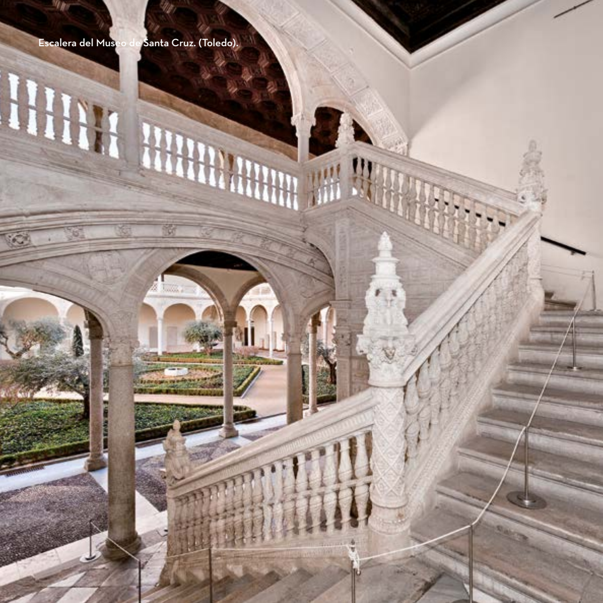
Escalera del Museo de Santa Cruz. (Toledo).

CREADOR INCANSABLE , a la vanguardia de los avances arquitectónicos de su época, Alonso de Covarrubias, nacido en Torrijos (Toledo) en 1488, fue uno de los grandes arquitectos del Renacimiento español y principal introductor de los fundamentos de la arquitectura «a la antigua» en aquel periodo. La ruta que permite contemplar algunas de sus obras más emblemáticas es un viaje en el tiempo, un recorrido por la historia y el arte de la España del siglo XVI. Castilla-La Mancha es el escenario de sus grandes proyectos, iglesias, palacios, capillas, claustros que hoy son visitados por miles de viajeros.