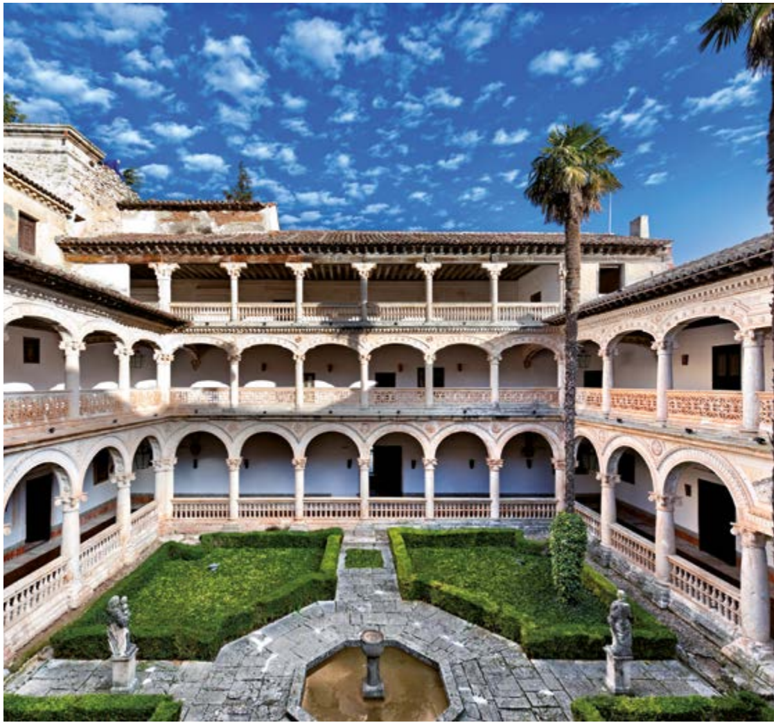
Claustro del convento de San Bartolomé de Lupiana. (Guadalajara).