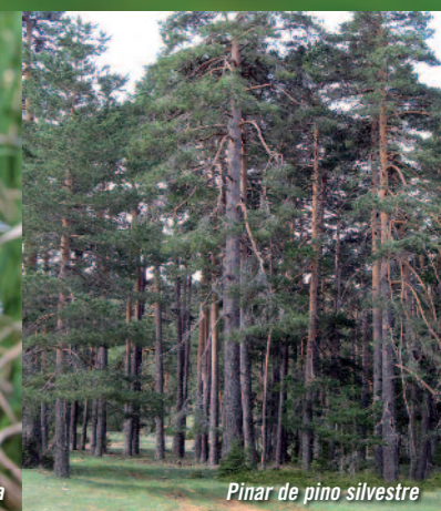
Pinar de pino silvestre