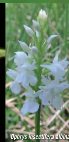
Ophrys insectifera albina