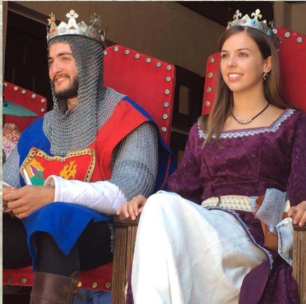
Reyes de las Jornadas Medievales 2019 D. a Blanca de Borbón y D. Pedro I