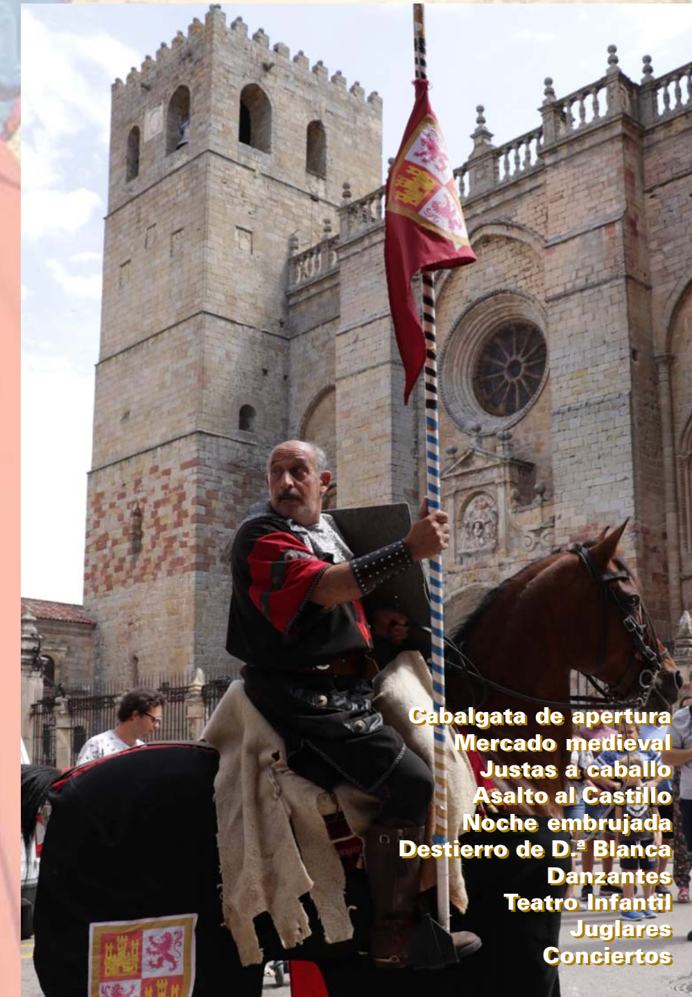
Cabalgata de apertura Mercado medieval Justas a caballo Asalto al Castillo Noche embrujada Destierro de D. a Blanca Danzantes Teatro Infantil Juglares Conciertos