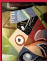
Plano de color Oleo/cartón (1935-1940)

El primero fue el creador y fundador de la Academia Moderna de las cuatro dimensiones, en Buenos Aires, donde ambos desarrollaron su carrera artística.