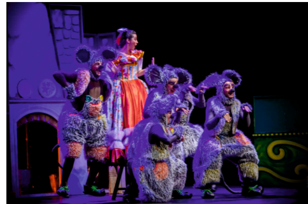
Cenicienta, el gran musical