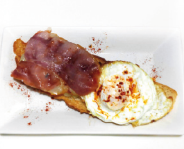
13 BAR LAS TURBAS C/ CALDERÓN DE LA BARCA, 22 TAPA: TAPA GRANJA