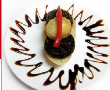
01 BAR EL CASTILLO C/ LARGA, 13 TAPA: BLANCO Y NEGRO