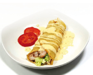
15 DE TAPA EN TAPA C/ COLÓN, 39 TAPA: CREPE DE GAMBAS CON SALSA DE MOSTAZA A LA MIEL