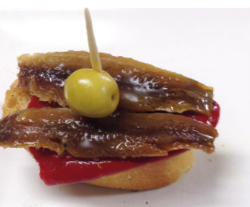
20 RTE. TOGAR AVDA. CASTILLA-LA MANCHA, 21 TAPA: ROLLITO DE SARDINA CON BASE DE PIQUILLO