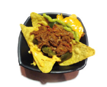
08 100 MONTADITOS C/ SAN FRANCISCO, 4 TAPA: DELICIA MEXICANA