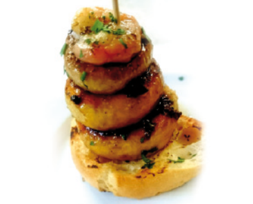
10 RTE. BIEN PORTEÑO PARQUE DE SAN JULIÁN, 18 TAPA: CHAMPIÑONES CON GAMBAS AL AJILLO