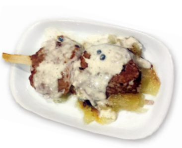
12 CAFÉ BAR BOGART C/ CALDERÓN DE LA BARCA, 35 TAPA: BROCHETA DE SOLOMILLO EN SALSA A LA PIMIENTA, SOBRE CAMA DE PATATAS AL MONTÓN