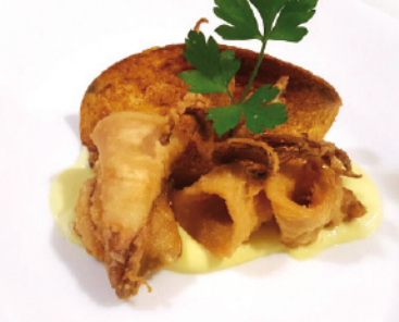
06 RTE. EL FUERO C/ LAS TORRES, 8 TAPA: CHIPIRÓN REBOZADO CON EMULSIÓN DE HUEVO Y ACEITE CON PATATA CRUJIENTE