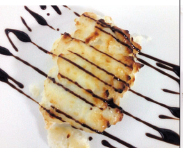
19 CAFETERÍA CUATRO CAMINOS C/ HURTADO DE MENDOZA, 1 TAPA: BACALAO AL AJO MIEL CON VINAGRETA DE MÓDENA