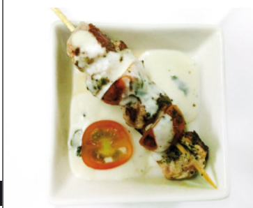
03 RTE. EL ALJIBE HOTEL CONVENTO DEL GIRALDO. SAN PEDRO, 12 TAPA: BROCHETA DE SOLOMILLO IBÉRICO EN SALSA DE QUESO CON UN TOQUE DE ALBAHACA