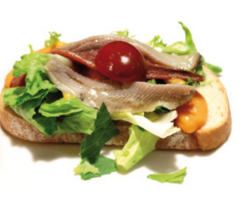
18 CERVECERÍA CASA CHARO AVDA. CASTILLA-LA MANCHA, 3 TAPA: DELICIAS CASA CHARO