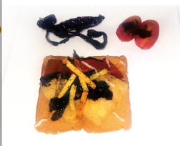
07 TUKU-TUKU C/ LAS TORRES, 30 TAPA: BACALAO EN TEMPURA ACOMPAÑADO DE CEBOLLA CARAMELIZADA Y SUAVE ALIOLI