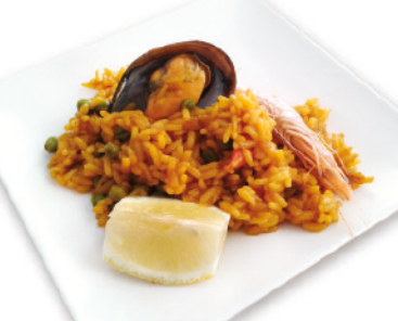
09 BAR BONI PARQUE DE SAN JULIÁN, 9 TAPA: PAELLA DE MARISCO