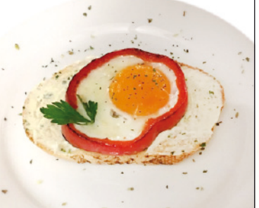
17 EL SOTANILLO AVDA. CASTILLA-LA MANCHA, 1 TAPA: TOSTA DE PIMIENTO AL HUEVO CON SOBRASADA DE ALIOLI