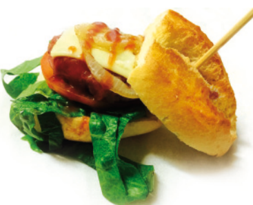
11 BAR LA SIESTA C/ HERMANOS VALDÉS, 4 TAPA: MINI BURGUER