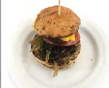
05 RTE. LAS BRASAS C/ ALFONSO VIII, 105 TAPA: MINI CLÁSICA "LAS BRASAS"