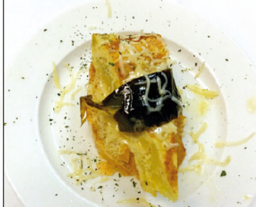
02 TEMPO LOUNGE BAR HOTEL LEONOR DE AQUITANIA. SAN PEDRO, 60 TAPA: TORTILLA DE PATATA CON QUESO GRATINADO Y PIMIENTO FRITO