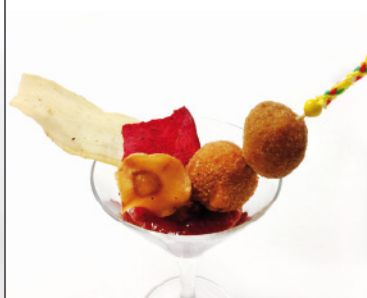
04 PARADOR DE CUENCA SUBIDA A SAN PABLO, S/N TAPA: CROQUETA DE GACHAS CON CHUTNEY DE FRESAS Y CHIPS DE VEGETALES