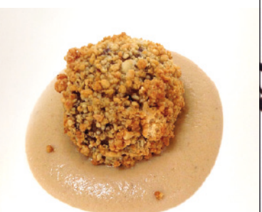
16 MARLO TAPERÍA C/ COLÓN, 41 TAPA: BOMBÓN DE MORCILLA, MANITA Y QUESO CON COLIFLOR TOSTADA