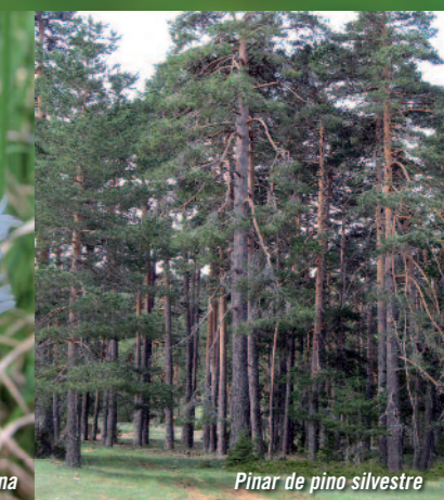
Pinar de pino silvestre