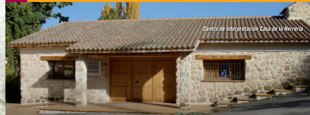
Centro de interpretación Casa de la Herrería

El acceso es libre y gratuito, y puede realizarse a través de tres itinerarios: