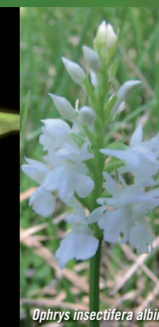
Ophrys insectifera albina