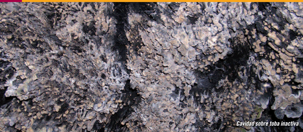
Cavidad sobre toba inactiva