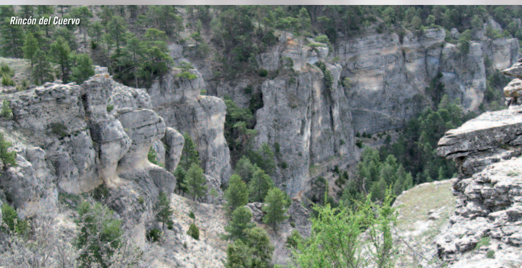
Rincón del Cuervo