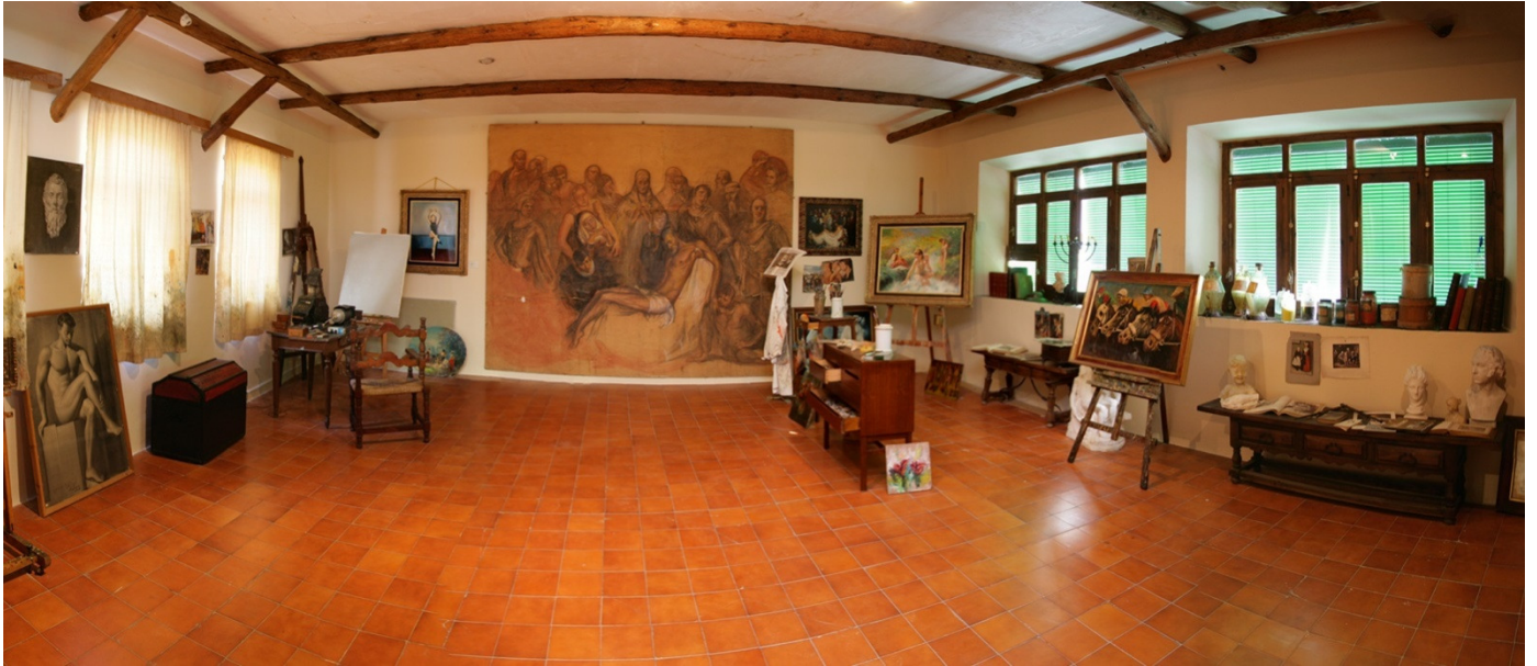
Vista panorámica del estudio del pintor.