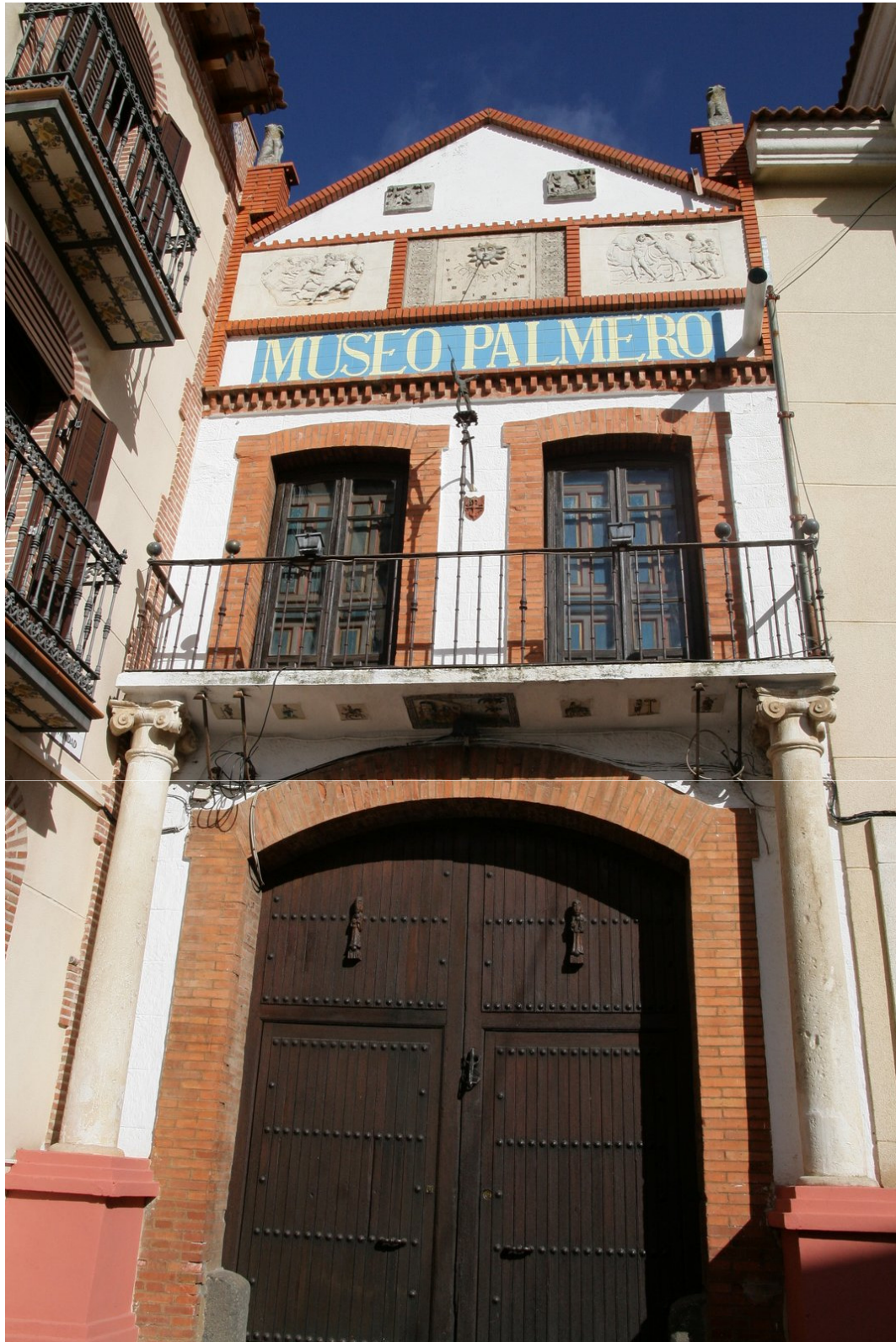
Museo Palmero Almodóvar del Campo Ciudad Real